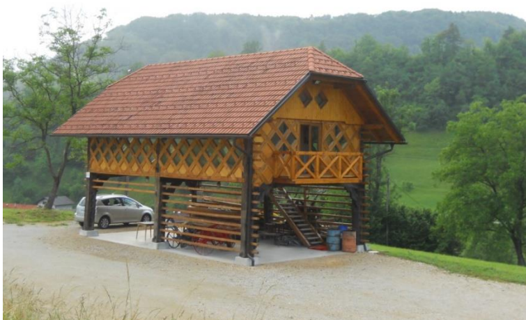
Slika 5: Kozolec na Slogih