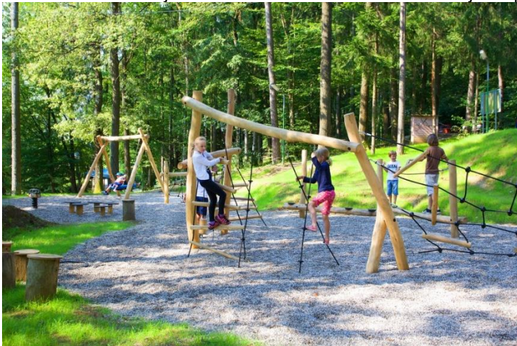
Slika 9: Šmartinsko jezero – atraktivna turistična destinacija na podeželju