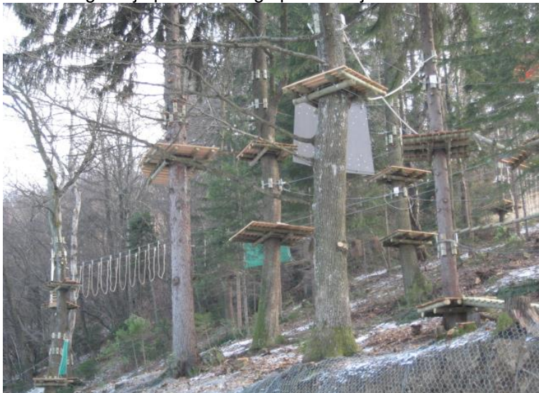
Slika 7: Izgradnja pustolovskega parka Celjska koča