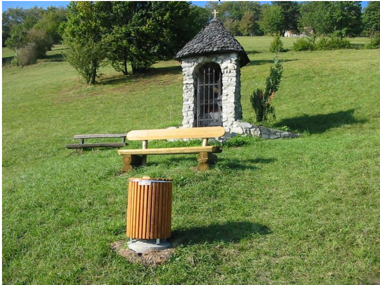
Slika 6: Celostna ureditev tematskih poti v občini Štore in ureditev tematske poti po Štorah