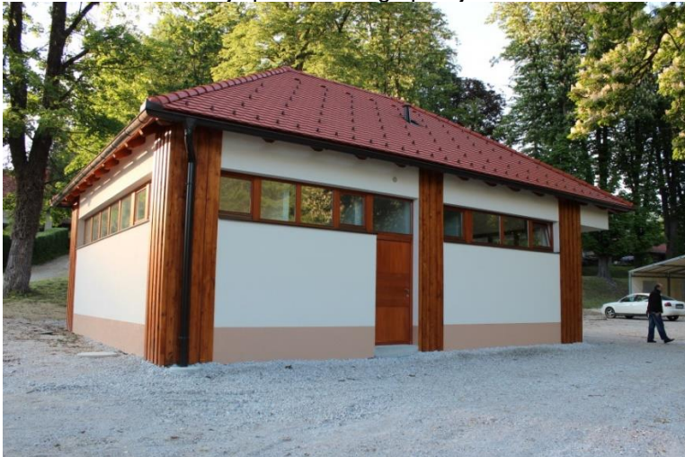
Slika 8: Rekonstrukcija prireditvenega paviljona na Frankolovem