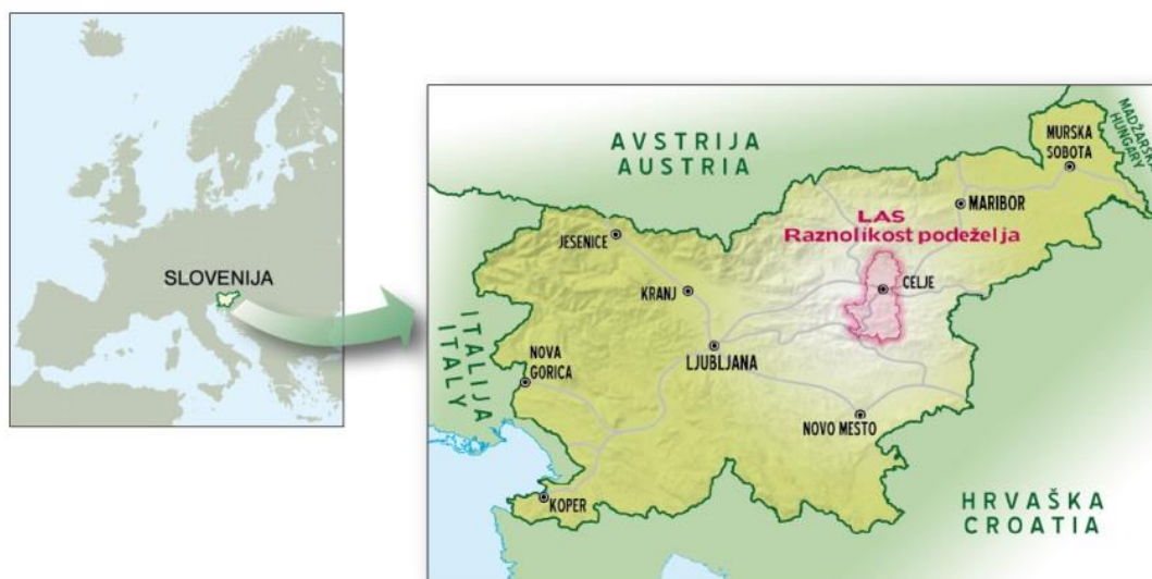
Slika 2: Prikaz lege območja LAS