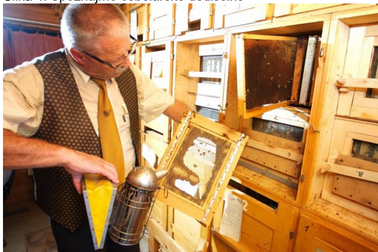
Slika 4: Spoznajmo čebelarstvo dediščino