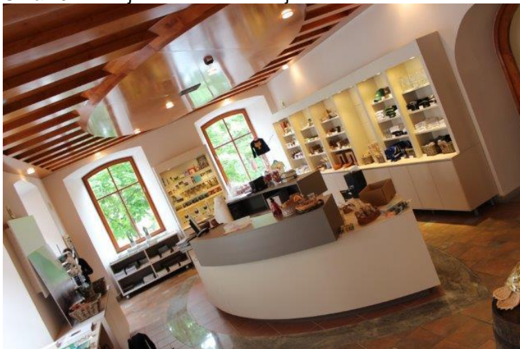
Slika 10: Prodajalna dobrot območja LAS